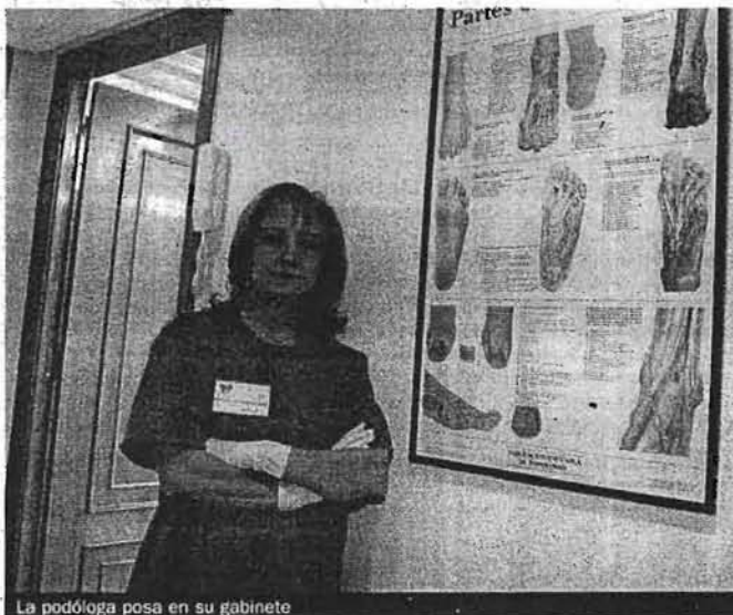
La podóloga posa en su gabinete

calzado, especialmente el de tacón alto; que provoca una sobrecarga del antepié en las articulaciones metatarso falángicas.